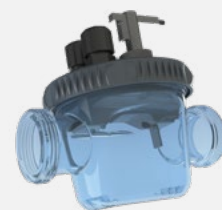
Chambre de mesure Uniquement Phileo POD VP