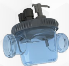
Chambre de mesure Uniquement Phileo POD VP

La pompe doseuse s'éclaire en fonction de la mesure et des alertes. En un coup d'oeil , vous avez une vision claire du pH de votre piscine ! Gain de temps et simplicité assuré durant la saison !