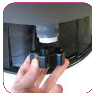
Drain avec son bouchon servant d'outil de démontage Drain with its plug which serves as dismantling tool - Drenaje que sirve para vaciar El agua del filtro y facilitar así la operación de invernación