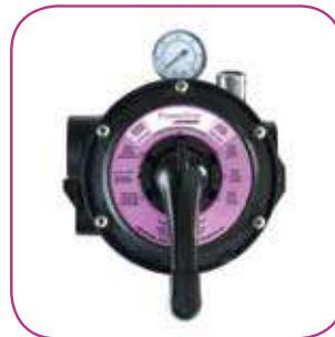
Vanne 6 positions 6 position valve Válvula 6 posiciones